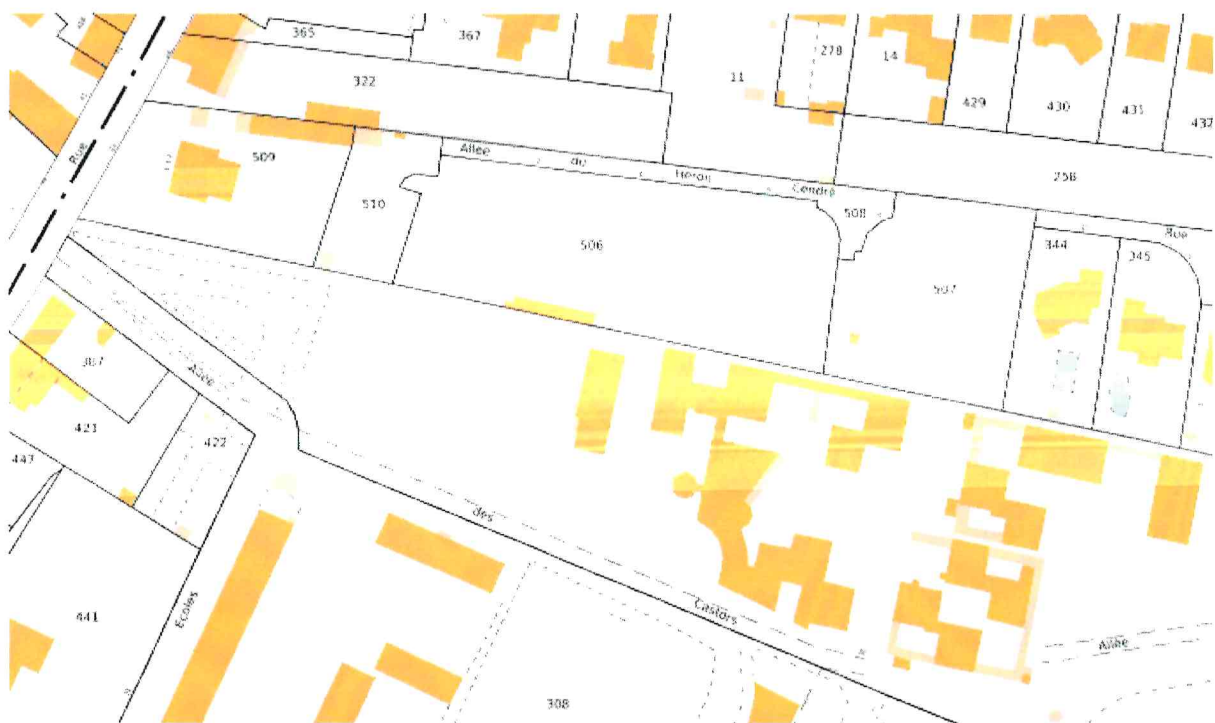
Figure 1 : Extrait de plan de cadastre

Ce bassin de rétention est raccordé à une canalisation de 300 mm de diamètre qui est ensuite connectée au réseau EP de la résidence La Villa des Sources, où une canalisation de 400 mm de diamètre collecte l'ensemble des eaux pluviales jusqu'à deux bassins de rétention TURBOSIDER de 2500 mm de diamètre implantés sur la parcelle G n° 507. Ces bassins se déversent ensuite au réseau public au niveau des Ecoles au moyen de pompes de refoulement.