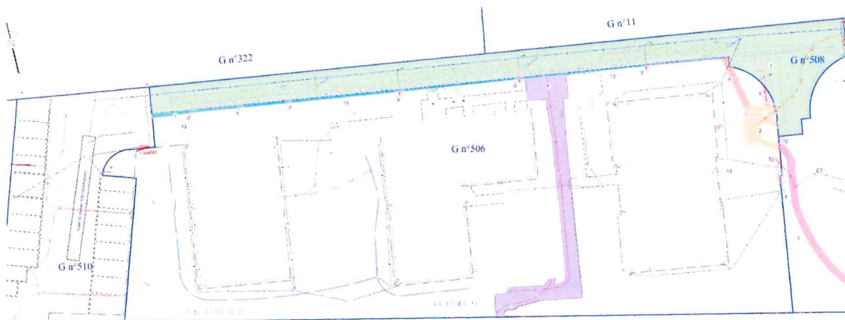
Figure 21 : Extrait du plan de servitudes (Servitude 1 - en vert)