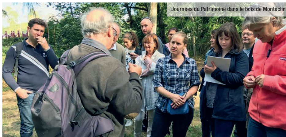
Journées du Patrimoine dans le bois de Montéclin