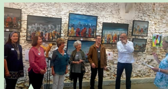
Exposition "Carte blanche" avec les six lauréats du Salon d'automne.