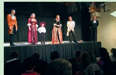
Représentation théâtrale des Compagnons de la Bohème et échanges avec les classes de CM2.