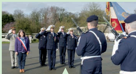
Centenaire de l'escadron d'hélicoptères 03.067 "Paris" de la base aérienne de Vélizy.