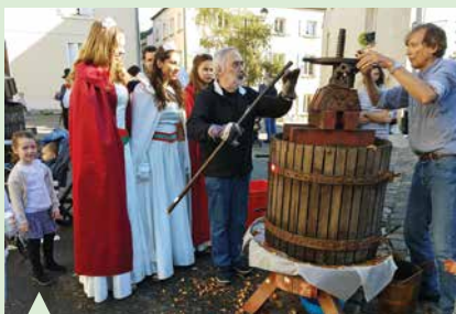
Pressurage des pommes.