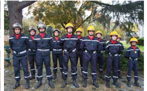
Nos jeunes sapeurs-pompiers, fidèles aux cérémonies commémoratives.