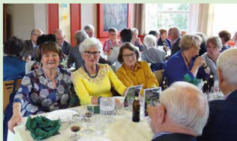
Banquet des anciens.