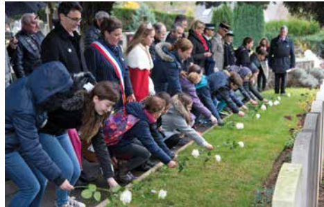
Cérémonie du 11 novembre : les enfants fleurissent les tombes des soldats anglais.

communedebievres @mairie91570 www.bievres.fr