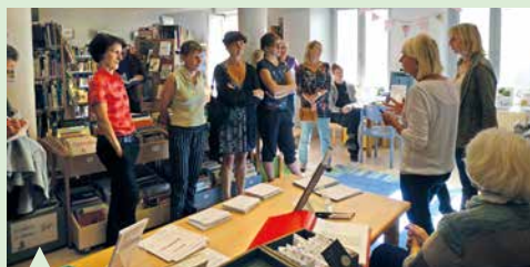
Inauguration de la grainothèque à la médiathèque.