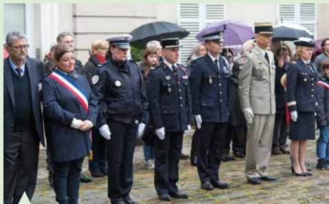
Cérémonie du 11 novembre.