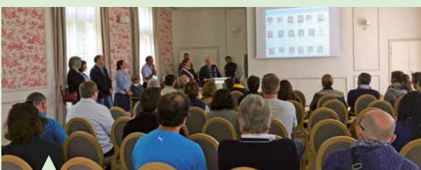
Samedi 9 septembre : accueil des nouveaux Biévrois