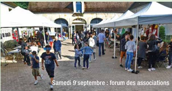
Samedi 9 septembre : forum des associations