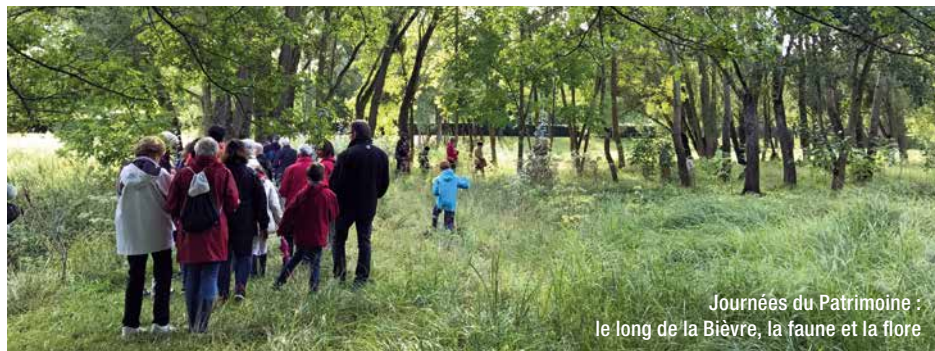
Journées du Patrimoine : le long de la Bièvre, la faune et la flore