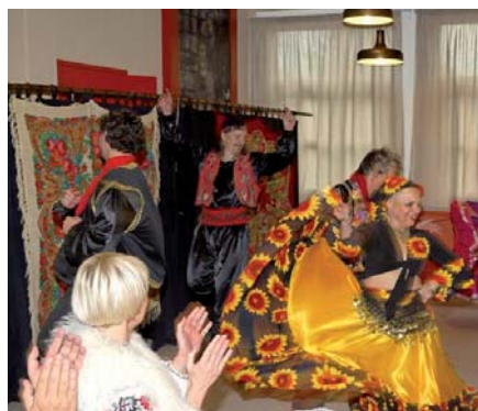
Banquet des Séniors

Si vous ne pouvez pas vous déplacer seul, signalez-le en téléphonant au foyer. Une personne viendra vous chercher à votre domicile.