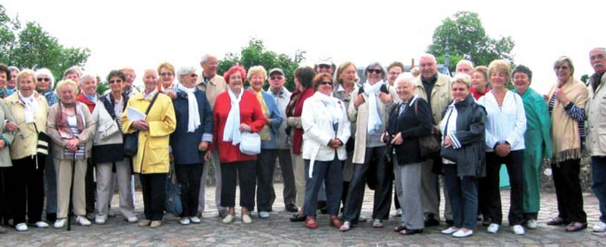
Escapade en Baie de Somme les 9,10 et 11 mai 2011

Mail : relaisanciens.bievres91@orange.fr