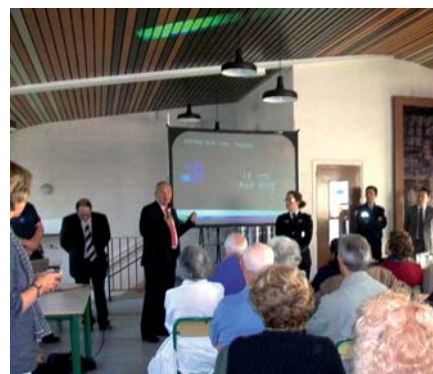
Réunion « sécurité »