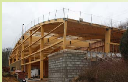
Nouveau tennis couvert