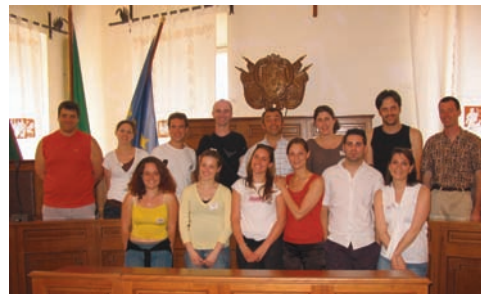
La troupe... en visite !