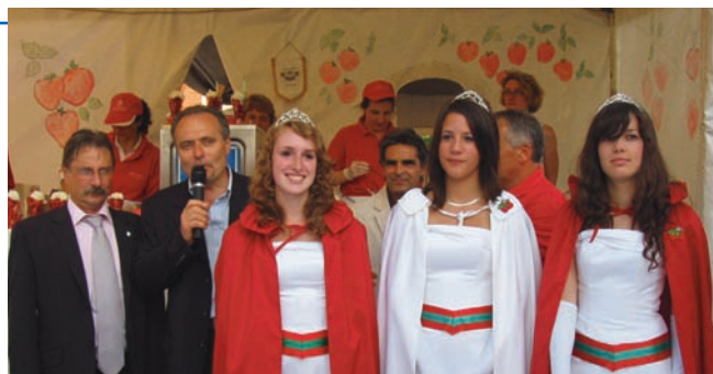
Les reines des fraises 2007 et le président du SICF accueillis par le président de la Prolocco

En 2007 nous nous rendons à Palestrina pour assister au 30ème anniversaire de la « prolocco » et nous sommes reçus avec fraternité par les familles. Durant notre séjour nous faisons découvrir à nos reines les beautés de la cathédrale, du musée archéologique, et la maison natale de Giovanni PIER-LUIGI berceau de la polyphonie à Palestrina ainsi que les richesses de Rome.