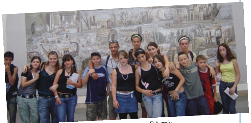
Quelques jours en Italie pour un groupe de jeunes Biévrois