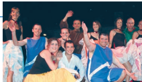
La troupe du Quadrille en tournée

Un avenir de star international s'ouvre à nous !