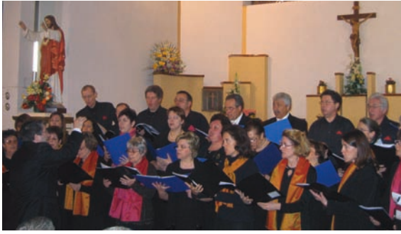
Le chœur du Val de Bièvre en concert à Palestrina