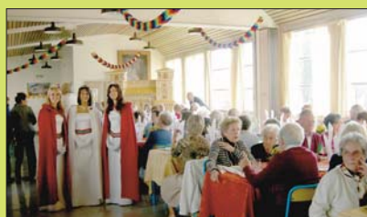
Les Reines des Fraises au banquet des Anciens

L'ambiance était très conviviale lors de notre brocante annuelle avec un soleil radieux et une belle participation de la population