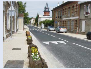
Rue de Paris Avant / après

devrait réduire les nuisances sonores pour les riverains et les piétons, et sécuriser l'ensemble de cette voie.