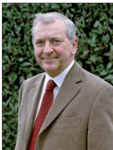
Hervé HOCQUARD Maire de Bièvres