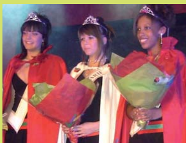
Les Reines des Fraises participeront aux nombreuses manifestations du mois de septembre