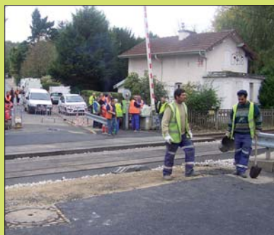
Le passage à niveau de la rue du Petit Bièvres a été rénové du 20 au 24 octobre.