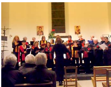
Le concert de Noël a eu lieu à l'Eglise