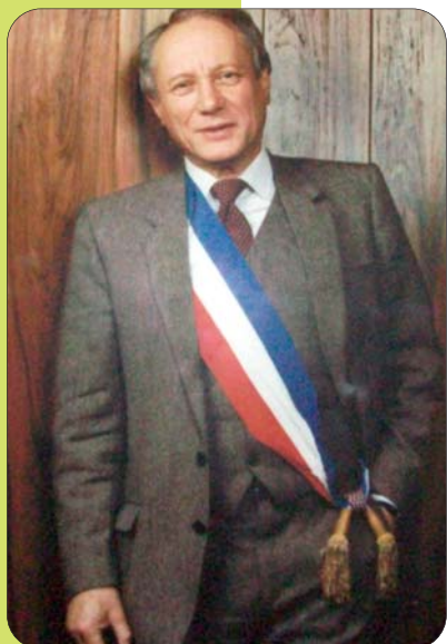
Raymond Longéras, Maire Honoraire de Bièvres, s'est éteint le dimanche 11 janvier 2009.