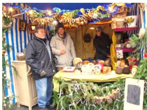
Les artisans fidèles au poste